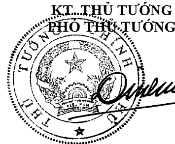
Vương Đình Huệ