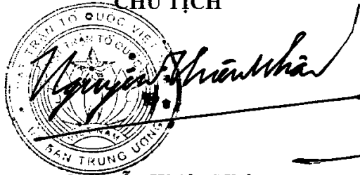
Nguyễn Thiện Nhân

TM. ĐOÀN CHỦ TỊCH ỦY BAN TRUNG ƯƠNG MẶT TRẬN TỔ QUỐC VIỆT NAM CHỦ TỊCH